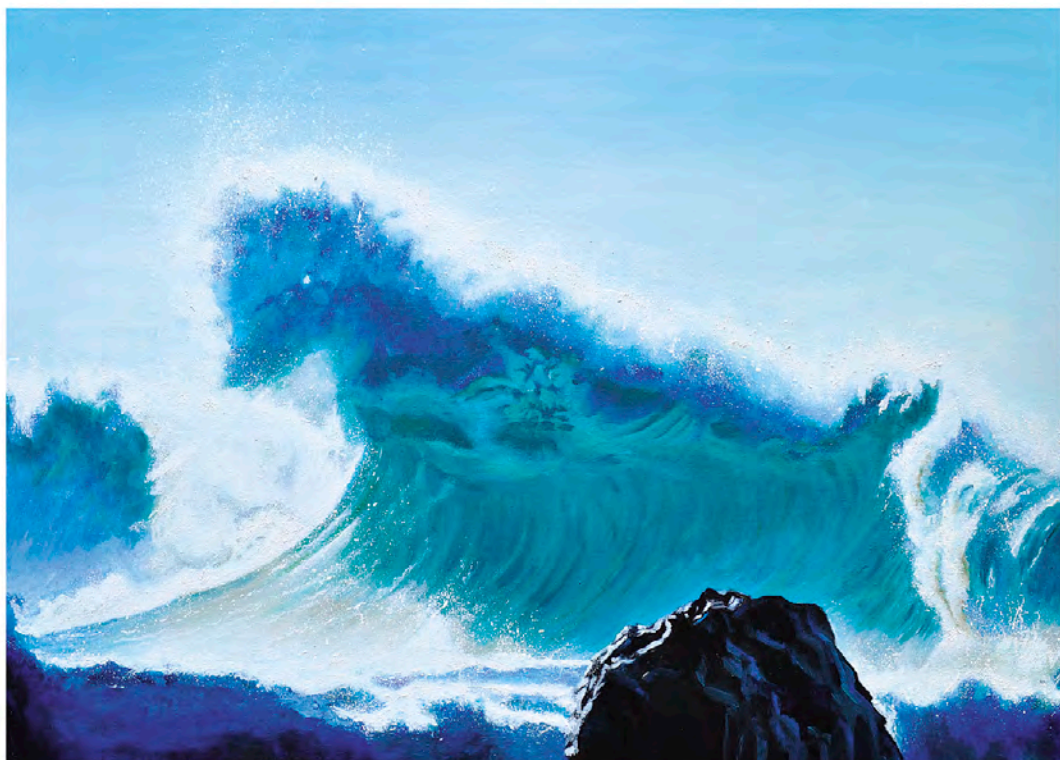
역동 oil on canvas 90.9×65.1 2013