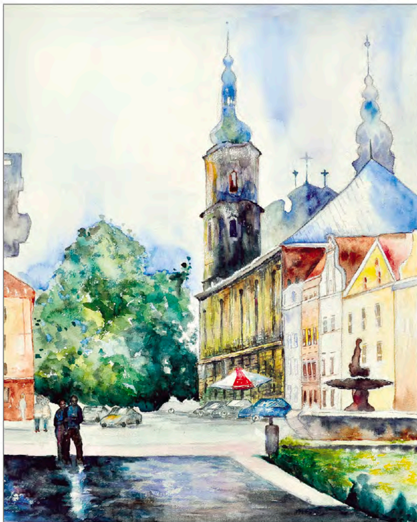
여행 watercolor on paper 72.7×53.0cm 2013