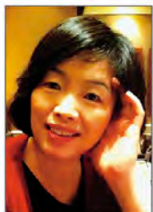
그림친구전(04~), 구미시 형곡동