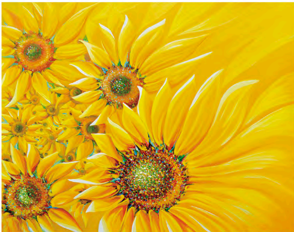
주·사·비 oil on canvas 116.8×91.0cm 2013