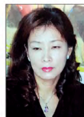
그림천구전(06~), 구미시 송정동