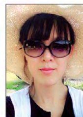
그림친구전(09~), 구미시 형곡동