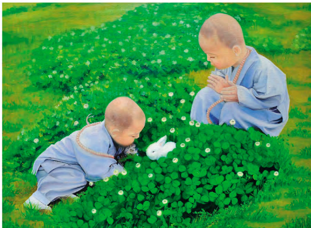
동자승의 하루 oil on canvas 72.7×53.0cm 2013