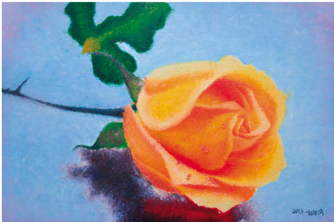
기다림 oil on canvas 40.9×27.3cm 2013