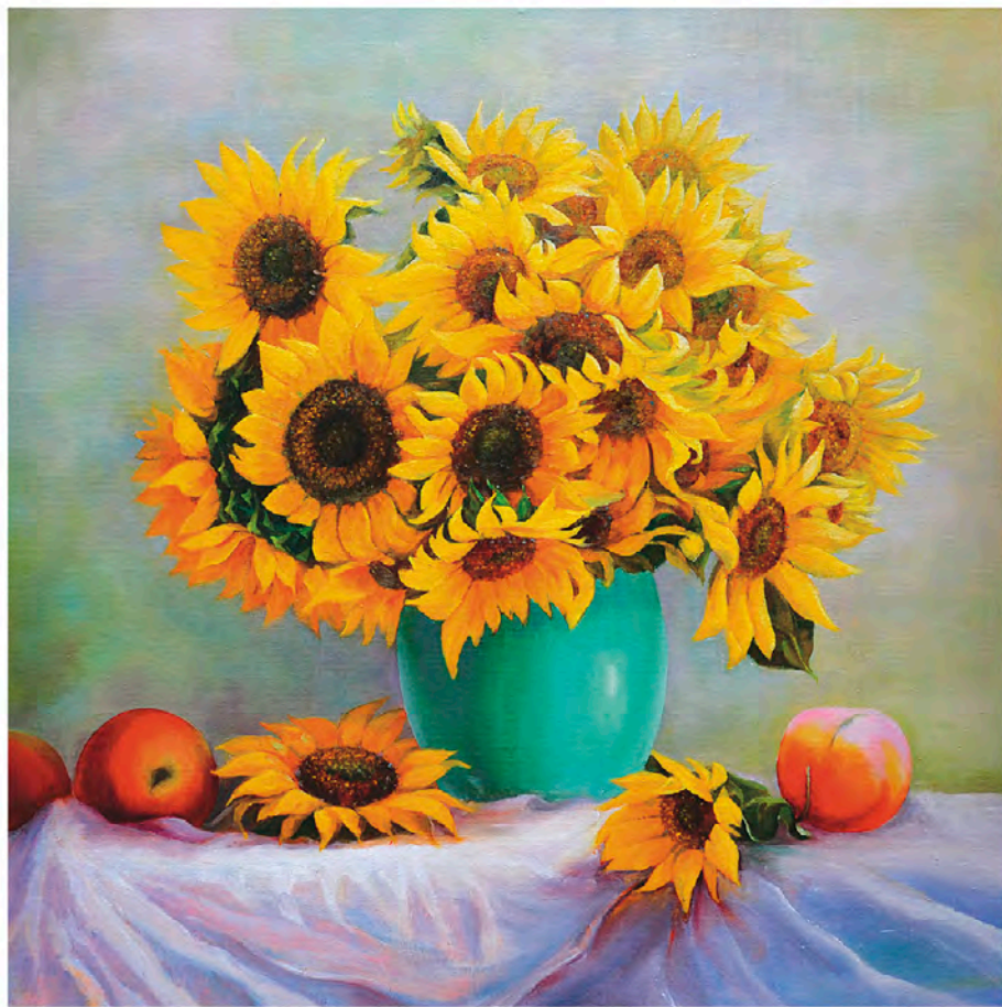
해바라기 oil on canvas 72.7×72.7cm 2013