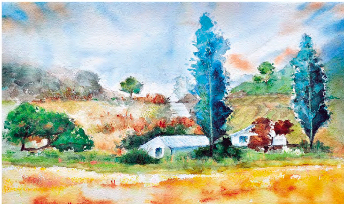
고향 watercolor on paper 45,5×27,3cm 2013