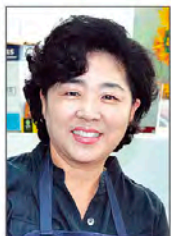
그림친구전(10~), 구미시 형곡동