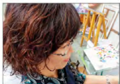
그림친구전(10~), 구미시 형곡동