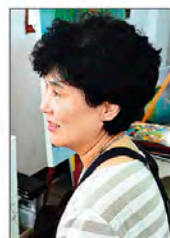
그림친구전(09~), 구미시 남풍동