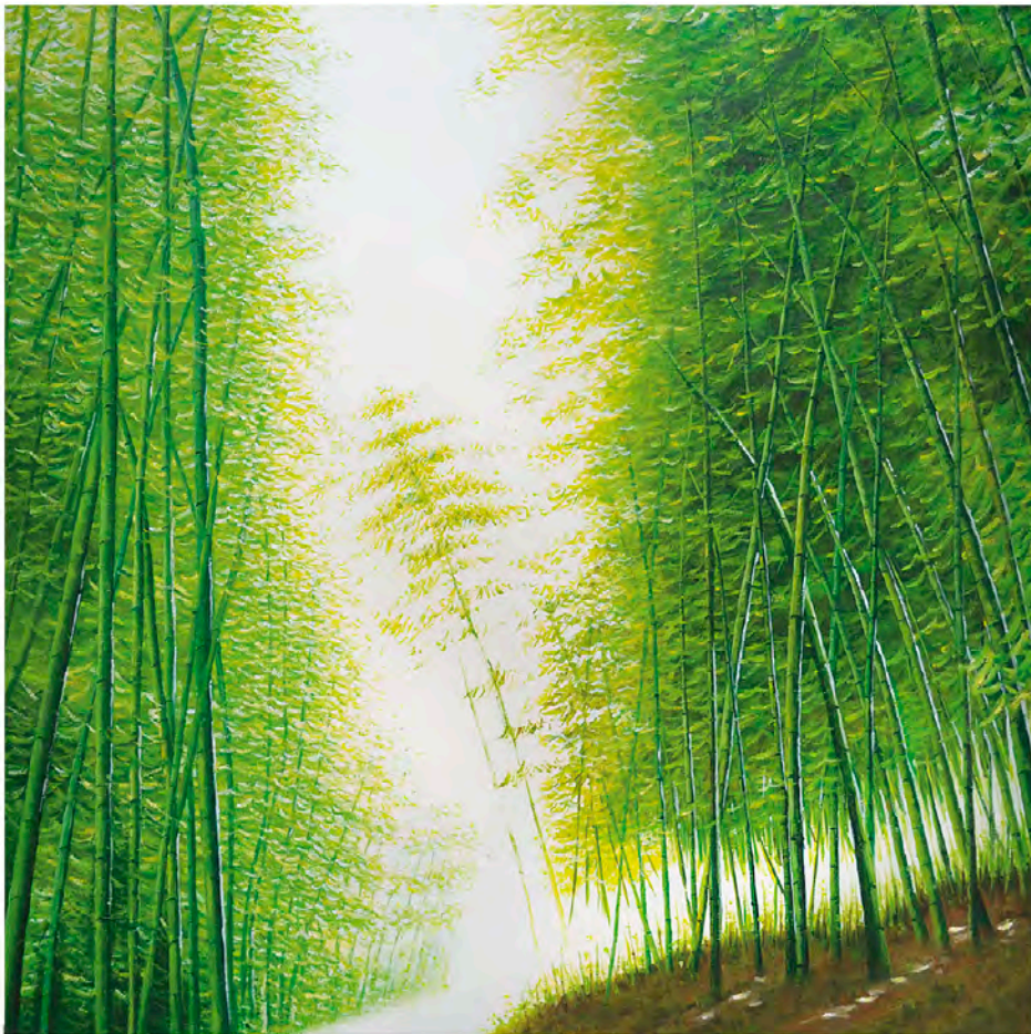
바람소리 oil on canvas 72.7×72.7cm 2013