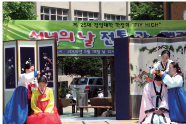
책임감과 자존감을 키우는 성년례