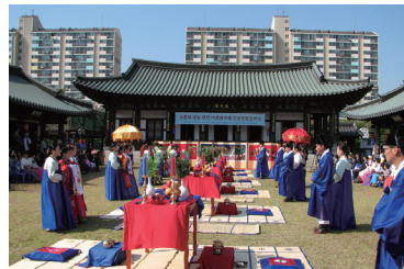
사랑과 존중으로 치르는 혼례