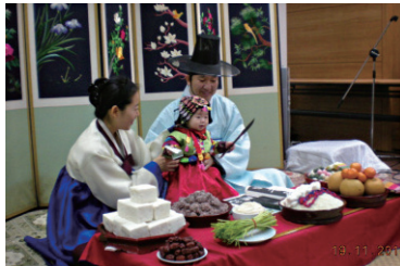
아이의 미래를 열어주는 백일/돌