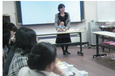
새 생명을 축복하는 태교

의례는 사람들이 생활 속에서 중요하게 여기는 때에 특별한 형식에 맞추어 하는 ‘예’를 말합니다. 조상들의 지혜를 담아 가정과 사회에 필요한 의례를 간결하게 치를 수 있도록 새로운 형식의 틀을 구성하여 행사를 지원하고 있습니다.