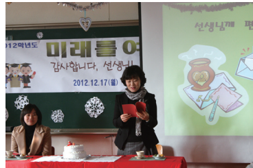
보람과 감사를 배우는 책례(책거리)