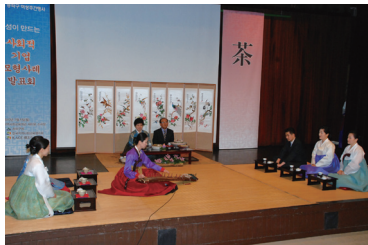
감사와 공경을 올리는 수연례